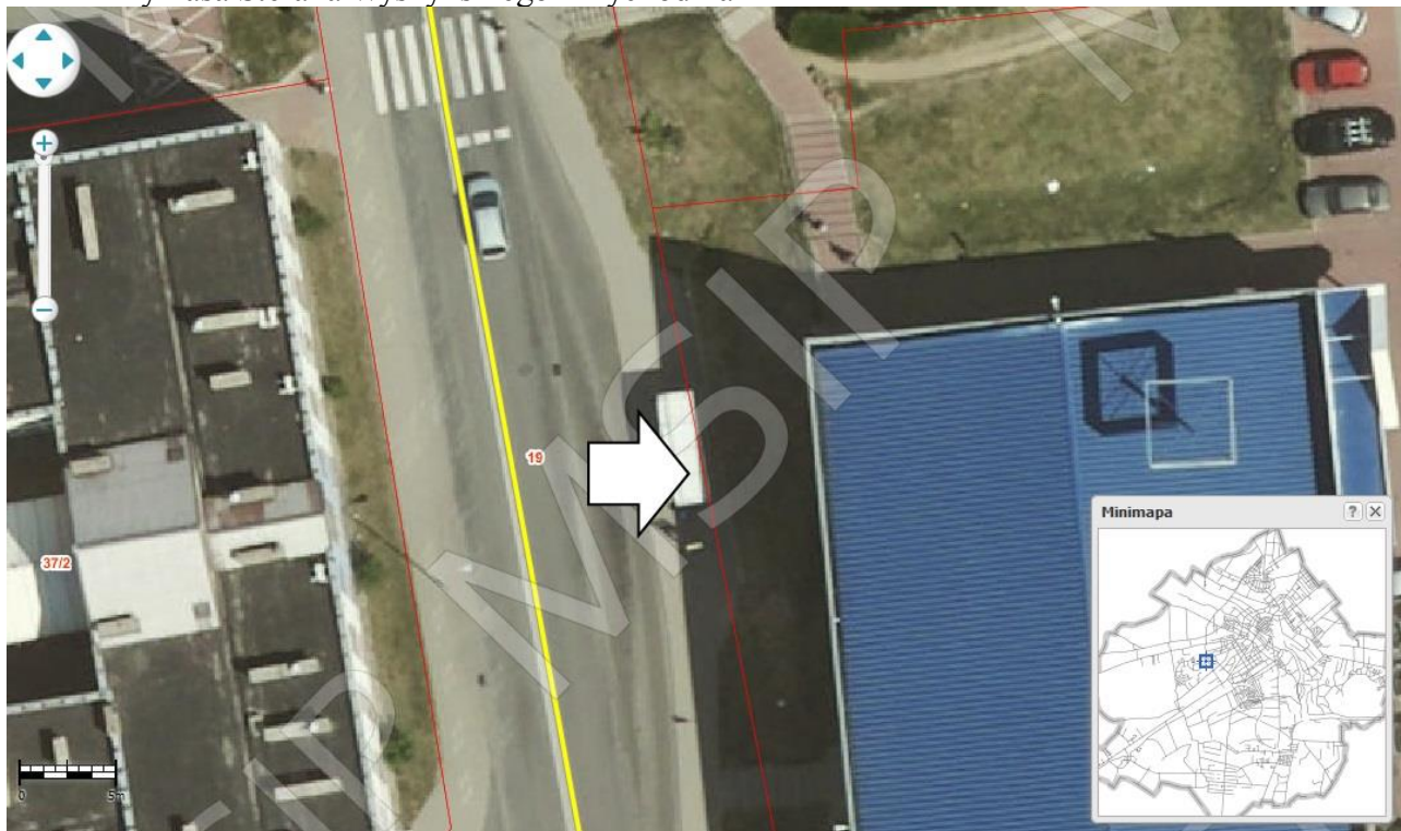
Rysunek 6 Prymasa Stefana Wyszyńskiego Przychodnia