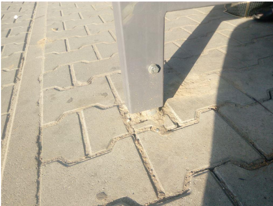
Rysunek 4 Kalisz, Górnośląska Dworzec PKS 05