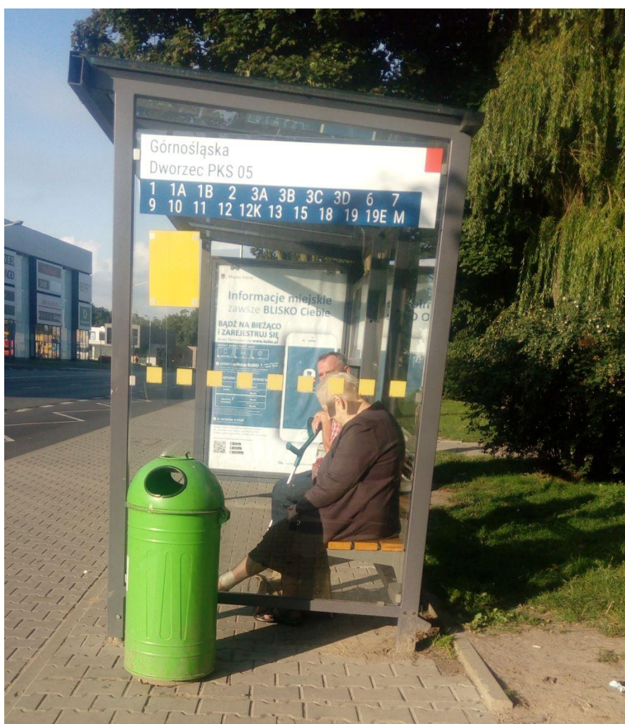
Rysunek 3 Kalisz, Górnosławska Dworzec PKS 05