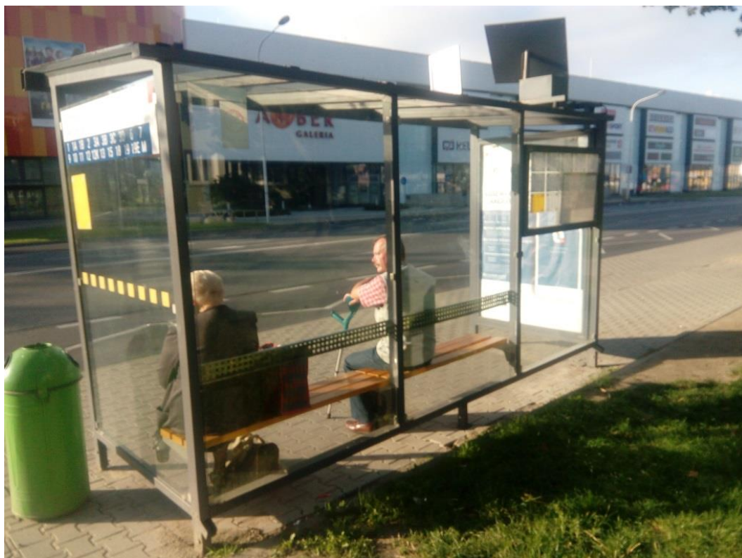
Rysunek 2 Kalisz, Górnosławska Dworzec PKS 05