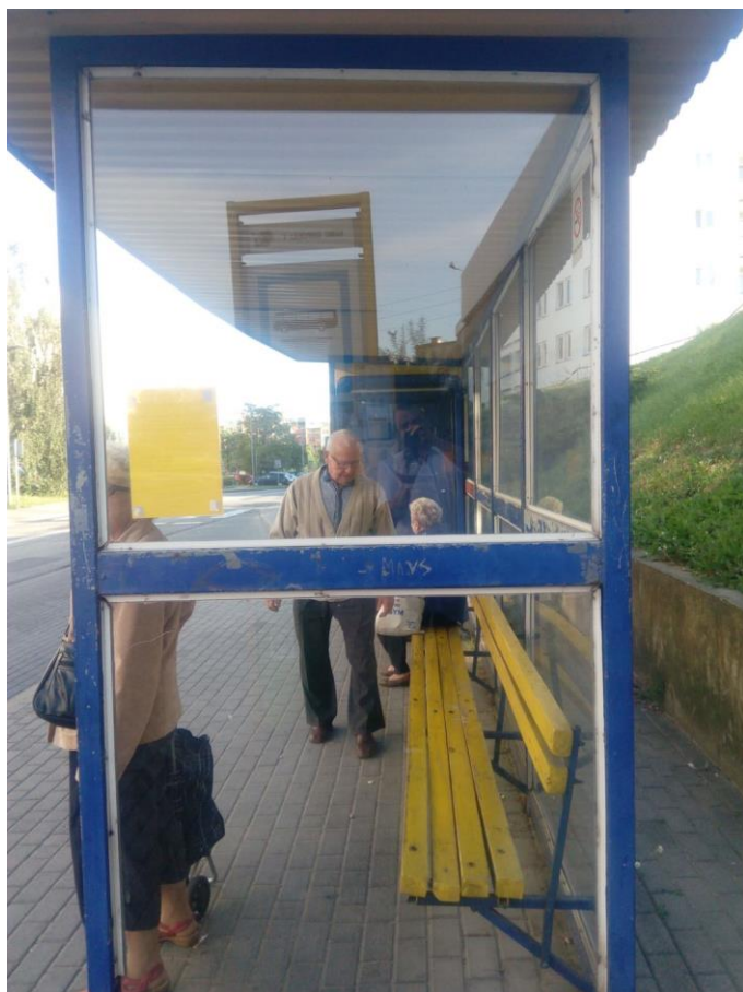
Rysunek 9 Prymasa Stefana Wyszyńskiego Przychodnia