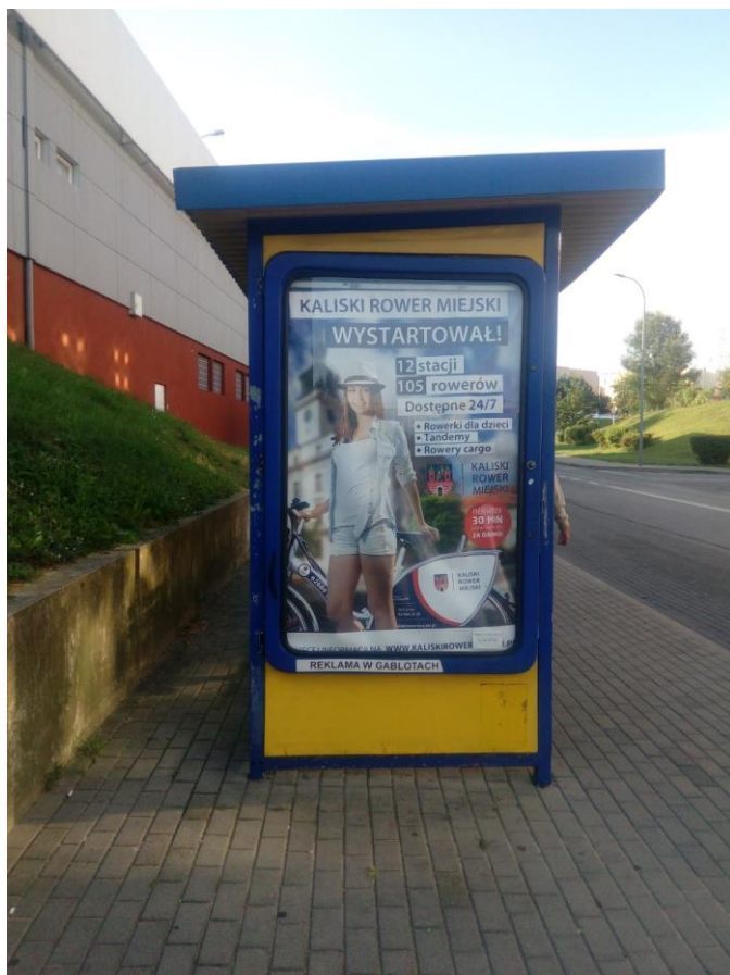
Rysunek 8 Prymasa Stefana Wyszyńskiego Przychodnia