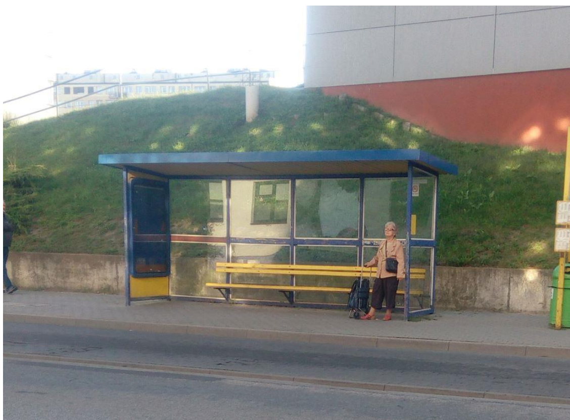
Rysunek 7 Prymasa Stefana Wyszyńskiego Przychodnia